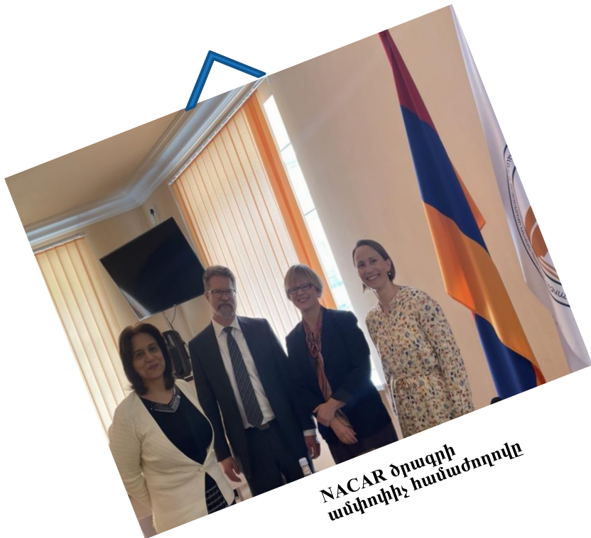
NACAR ծրագրի ամփոփիչ համաժողովը

NACAR ծրագրի նպատակն է Հայաստանում և Նորվեգիայում ակադեմիական ներուժի զարգացումը և երկու երկրների բուհերի միջև համագործակցության խթանումը՝ օտարերկրյա ուսանողների ընդունելության և ճանաչման հնատիտուցիոնալ թափանցիկ չափանիշների և ընթացակարգերի կիրարկմամբ: Ծրագիրն ուղղված է որակավորումների ճանաչման հնատիտուցիոնալ ընթացակարգերի մշակմանը: