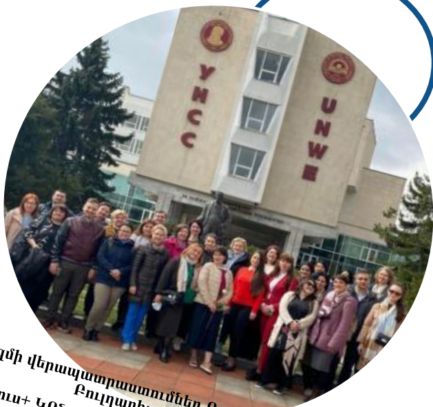
ՊԳ կազմի վերապատրաստումներ Ռուսիայում և Էրազմուս+ ԿՈՆՆԵԿՏ ծրագրի շրջանակներում

ԿՈՆՆԵԿՏ ծրագրի նպատակն է համալսարան-տնտեսություն կապի ամրապնդումը՝ հիմնված Արևելյան գործընկերության բուհերի խելացի (հարմարեցված) ձեռնարկատիրական մոտեցման վրա, ինչպես նաև ուսանողների և շրջանավարտների մրցակցային ուսումնասիրության (վարք, հմտություններ, մտածելակերպ) և աշխատատեղեր ստեղծելու կարողության զարգացումը: